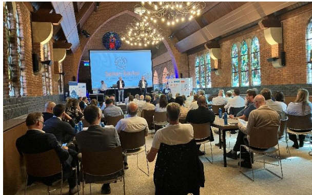
ALV 20 mei 2025